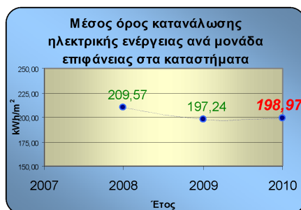
Διάγραμμα 2. Μέσος όρος της κατανάλωσης ηλεκτρικής ενέργειας ανά m^2 σε καταστήματα της Τράπεζας το διάστημα 2008-2010

Η μείωση της κατανάλωσης ενέργειας στα κτήρια ήταν προτεραιότητα της Τράπεζας. Καθημερινές ενέργειες από το ανθρώπινο δυναμικό, όπως η απενεργοποίηση των ηλεκτρονικών συσκευών και η αποφυγή της χρήσης του standby , η ρύθμιση της θερμοκρασίας του θερμοστάτη των κλιματιστικών όχι πάνω από τους 23 °C για θέρμανση και όχι κάτω από τους 26 °C για δροσισμό, ή ακόμα και το κατέβασμα των σκιάστρων τις μεσημεριανές ώρες του καλοκαιριού, είχαν σημαντικά αποτελέσματα εξοικονόμησης ενέργειας. Στο παρακάτω διάγραμμα παρουσιάζεται η εξέλιξη των 3 τελευταίων ετών του μέσου όρου κατανάλωσης ηλεκτρικής ενέργειας ανά m^2 στα καταστήματα της Τράπεζας.